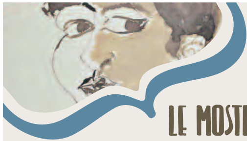
Antonietta Raphaël Mafai, Ritratto di Mafai, acquerello, 21x17,5, 1928 Collezione privata